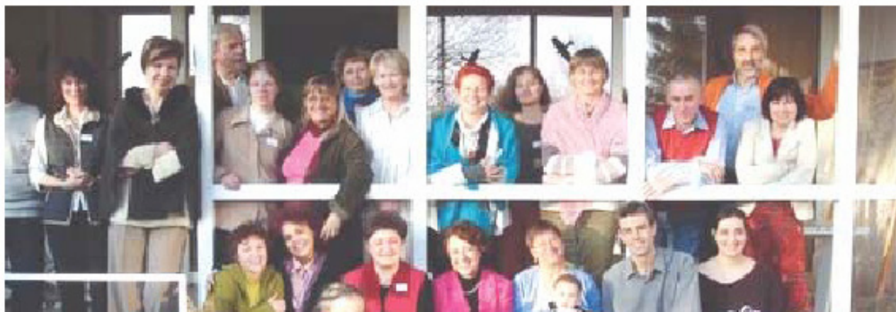
Ιδρυμα ESSE (Δανία)