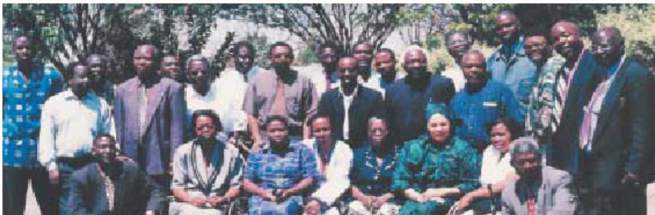
Το Ινστιτούτο Εκπαίδευσης Σάτνα Σάι της Ζάμπια κάνει επιμορφωτικά σεμινάρια Σάτνα Σάι στις Ανθρώπινες Αξίες σε εκπαιδευτικούς από Αφρικανικές χώρες

Είναι σχολεία που λειτουργούν καθημερινά εκτός του σχολικού ωραρίου, για παιδιά 5 έως 15 ετών. Διευθύνονται από το ISSE ή τους γονείς, εθελοντές Σάι. Τέτοια σχολεία δεν υπάγονται στο πρόγραμμα του Υπουργείου Παιδείας. Στα σχολεία αυτά, η Εκπαίδευση στις Ανθρώπινες Αξίες ολοκληρώνεται με μια πληθώρα μαθημάτων, όπως είναι η τέχνη, το θέατρο, ο χορός, οι υπολογιστές, η βιολογική καλλιέργεια, η μαγειρική, η μουσική και οι χειρωνακτικές εργασίες. Το προσωπικό είναι εθελοντές αλλά και μισθωτοί επαγγελματίες δάσκαλοι.