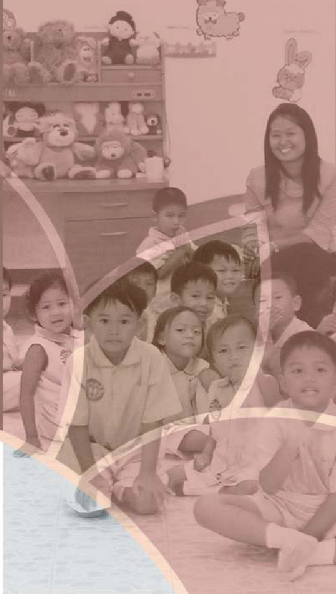
Σχολείο Σάνα Σάι στην Ταϊλάνδη