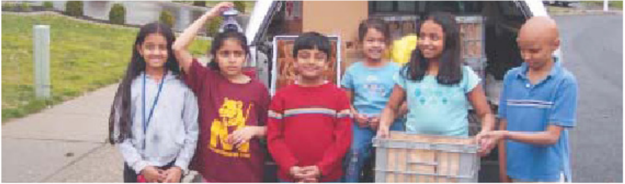
Ηνωμένες Πολιτείες Αμερικής