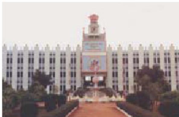
Το παράρτημα του Πανεπιστημίου στο Μπριντάβαν