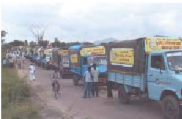
Υπηρεσία στα χωριά (Grama Seva) από τους φοιτητές και το προσωπικό του Πανεπιστημίου Σάτσα Σάι

«Στην Ινδική παράδοση πιστεύεται πως η Αλήθεια (Σάτσα) είναι ο Θεός. Όπως επιβεβαιώνει το μοντέλο εκπαίδευσης Σάι, οι φοιτητές του Πανεπιστημίου δεν είναι απλώς φοιτητές αλλά αναζητητές της Αλήθειας. Μ' αυτό τον τρόπο η θεϊκή καθοδήγηση του Σάτσα Σάι ανύψωσε ακόμη και την εκπαίδευση στο επίπεδο της λατρείας στον Θεό.» - Α.Β.Βατζπαγή, τότε Πρωθυπουργός της Ινδίας, στην ομιλία του σε Συνέδριο στο Πανεπιστήμιο Σάτσα Σάι στις 22 Νοεμβρίου 1998