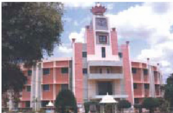
Το παράρτημα του Πανεπιστημίου στην Ανανταπούρ

Το υψηλό ακαδημαϊκό επίπεδο εγγυώνται οι αφοσιωμένοι καθηγητές που ζουν στο χώρο του Πανεπιστημίου. Στους φοιτητές παρέχονται οι καλύτερες ευκαιρίες και το κατάλληλο περιβάλλον, μέσα και έξω από την τάξη, για να πετύχουν ακαδημαϊκή υπεροχή. Τα ερευνητικά προγράμματα του Πανεπιστημίου έχουν άμεση σχέση με τις κοινωνικές ανάγκες. Η εκπαίδευση στο Πανεπιστήμιο στοχεύει στο να παρέχει υψηλό επίπεδο συλλογισμού και έρευνας. Το Πανεπιστήμιο ήταν το πρώτο στην Ινδία που παρείχε ένα ολοκληρωμένο πρόγραμμα πενταετούς διάρκειας σπουδών που μπορούν να οδηγήσουν σ' ένα διδακτορικό τίτλο, απαιτώντας απ' τους φοιτητές αυστηρή προσήλωση απ' τον πρώτο χρόνο.