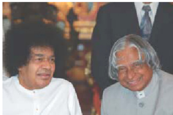
Ο Σάτυα Σάι Μπάμπα με τον Πρόεδρο της Ινδίας, Αμπντούλ Κάλாம், μετά από τα εγκαίνια του Αθλητικού Κέντρου

Οι φοιτητές έχουν το μοναδικό προνόμιο να καθοδηγούνται προσωπικά από εκείνον σε ακαδημαϊκά, πνευματικά και προσωπικά θέματα.