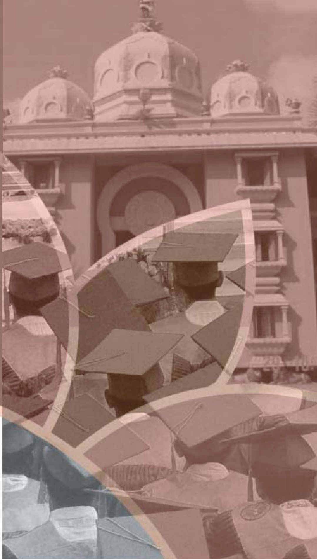
Άποψη του Πανεπιστημίου Σρι Σάτνα Σάι στο Πρασάντι Νίλαγιαμ