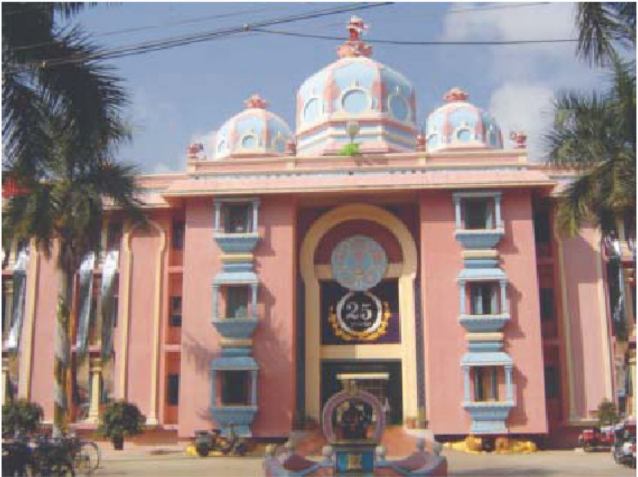
Το Πανεπιστήμιο Σρι Σάτυα Σάι στο Πρασάντι Νίλαγιαμ

Το κλειδί της αυτοπεποίθησής τους είναι η αγάπη τους για τον σεβαστό τους Πρύτανη και η επιθυμία τους να τον κάνουν ευτυχισμένο. Η ζωή στο Πανεπιστήμιο προσφέρει άφθονες ευκαιρίες στους φοιτητές να αναπτύξουν τα ταλέντα τους στη μουσική, στο χορό, στο θέατρο και στη ρητορική.