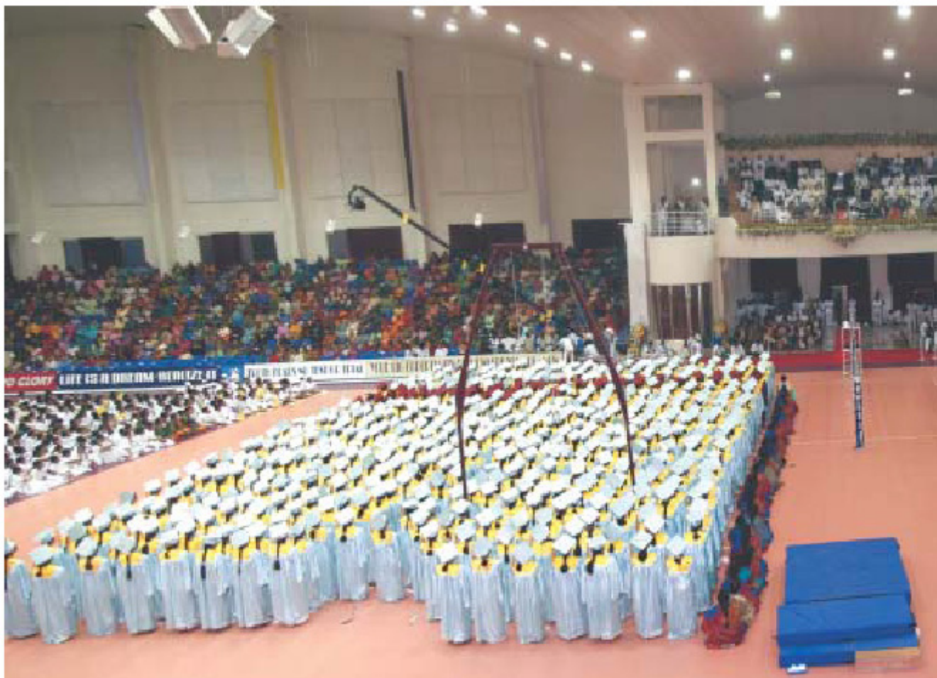
Πανοραμική άποψη της εκδήλωσης για την 25 η επέτειο του Πανεπιστημίου, που πραγματοποιήθηκε στο Διεθνές Αθλητικό Κέντρο του Πονταπάρτι, στις 22 Νοεμβρίου 2006

Η αυτοπεποίθηση είναι το θεμέλιο, η αυτοθυσία είναι οι τοίχοι, η αίσθηση της ικανοποίησης είναι η οροφή και η αυτοπραγμάτωση είναι η ζωή. Αυτό είναι το Μέγαρο της ζωής το οποίο πρέπει να επιθυμεί κανείς.