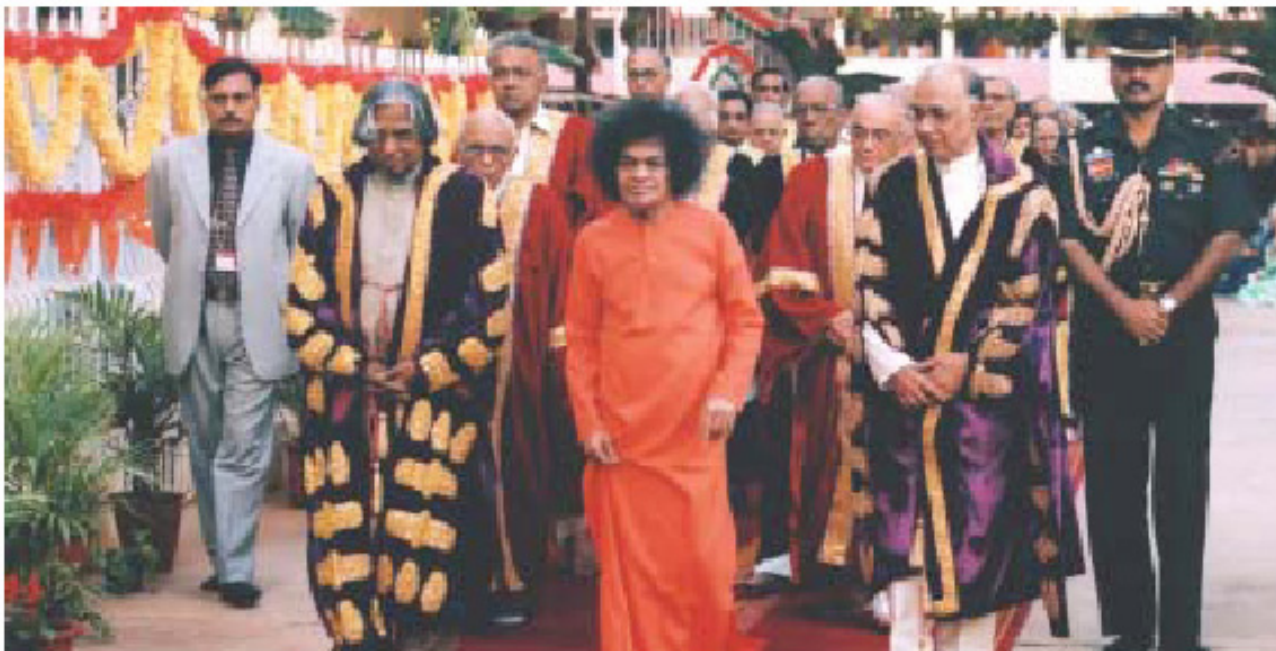
Ο Πρύτανης Σάτυα Σαΐ Μπάμπα, ο Αντιπρύτανης, καθηγητές του Πανεπιστημίου και ο επίσημος προσκεκλημένος, Πρόεδρος της Ινδίας, σε τελετή απονομής πτυχίων

«Αυτό το Πανεπιστήμιο δεν θα διδάσκει Βοτανολογία απλώς για την γνώση των δέντρων στη φύση, θα μεταδίδει τη γνώση του δέντρου της αληθινής ζωής.