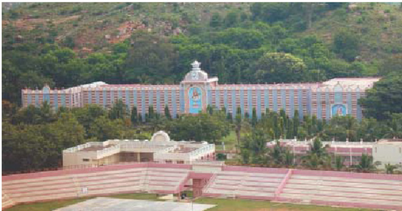
Αποψη του Πανεπιστημίου Σάτυα Σάι στο Πρασάντι Νίλαγιαμ με το στάδιο Hill View στο προσκήνιο